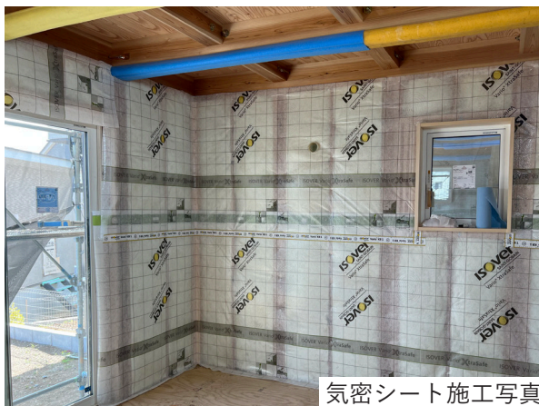
気密シート施工写真