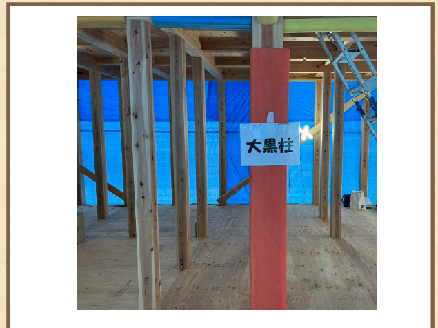
前回構造見学会の様子